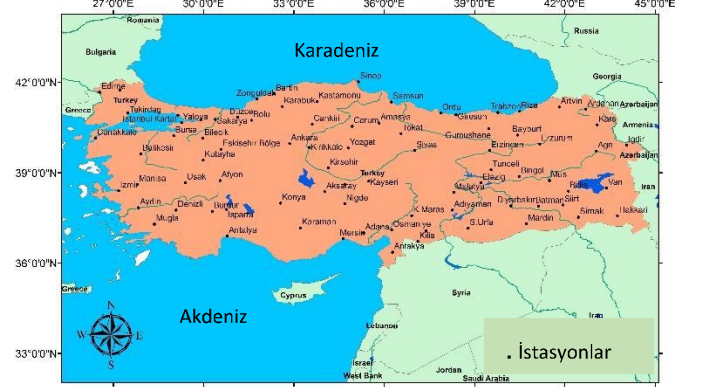
Şekil 1. Çalışılan MGM istasyonları

Bu veriler Meteoroloji Genel Müdürlüğü (MGM)’nden temin edilmiştir. Veri sayısı 30 yıldan dan az olan istasyonlar istatistiksel anlamlılık açısından yetersiz olduğu kabulü ile çalışmaya dahil edilmemiştir. Çalışmada kullanılan istasyonların dağılımı Şekil 1’de yer almaktadır.