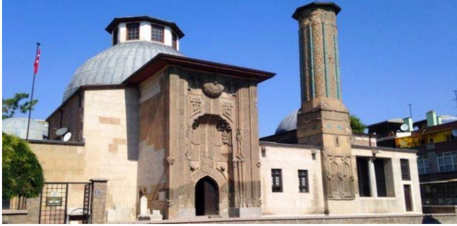
Fotoğraf 1: Sahip Ata Darülhadiisi/İnce Minareli Medrese (Seyahatdergisi.com).