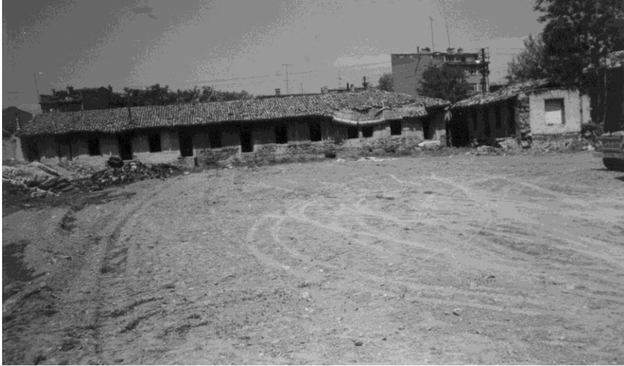
Fotoğraf 2: Musahip Mustafa Paşa/Şeyh Ahmed Efendi Darülhadiisi yıkılmadan kısa süre önce.