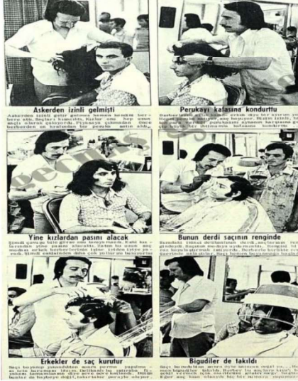
Asterden izini gelmişti